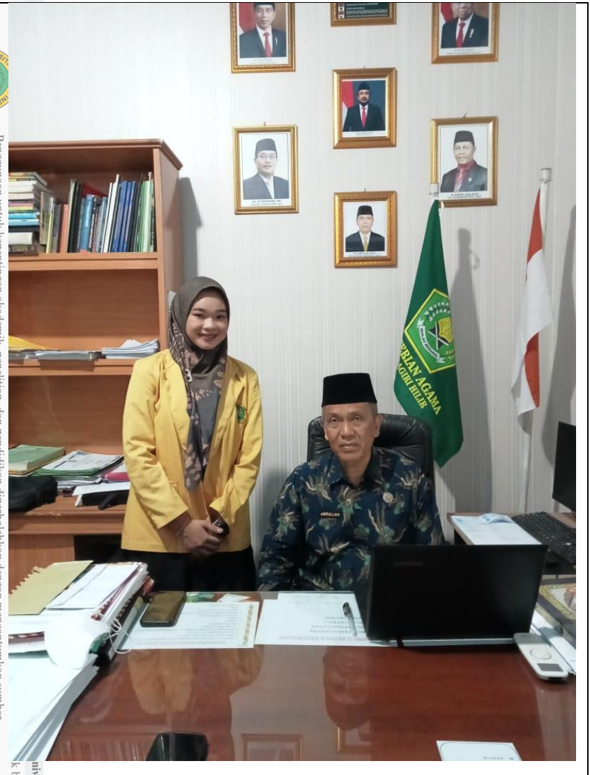
Universitas Islam Indragiri K. Bervenang.