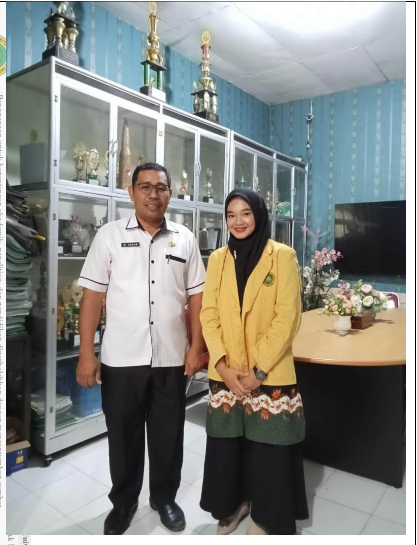
Institusi Islam Indragiri tidak berwenang.